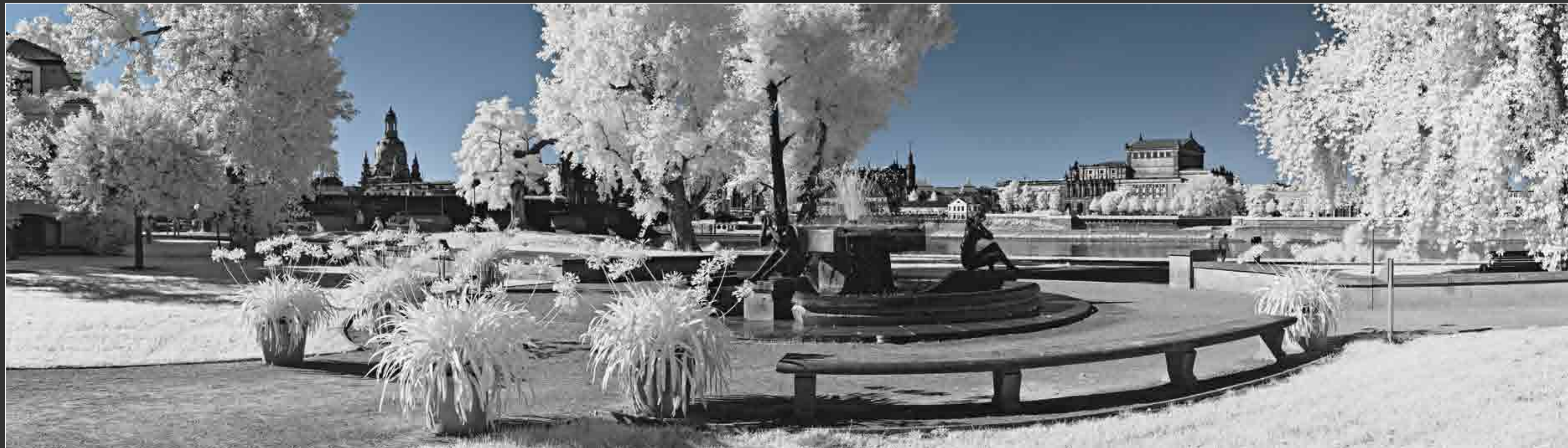
BRUNNEN »DREI GRAZIEN«